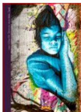
MURAL 1: Technicolor dream

Korice su definirane za svaku bilježnicu, ali ih po želji možete promijeniti. Ponuđene su korice: