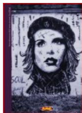
MURAL 2: Soul