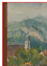
SLAVA 4: Pogled s brda na Samobor (detalj)