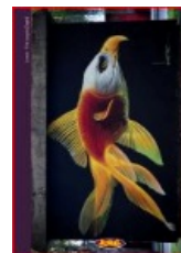
MURAL 5: Fish eagle