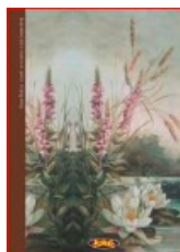
SLAVA 3: Lopoči uz cvjetnu livadu (nepotvrđeno)