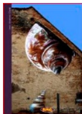
MURAL 3: Xenophora 1