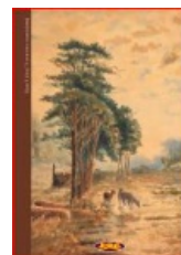
SLAVA 5: Tri srne blizu naselja (detalj)