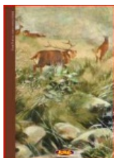
SLAVA 1: Jeleni na bojni (detalj)